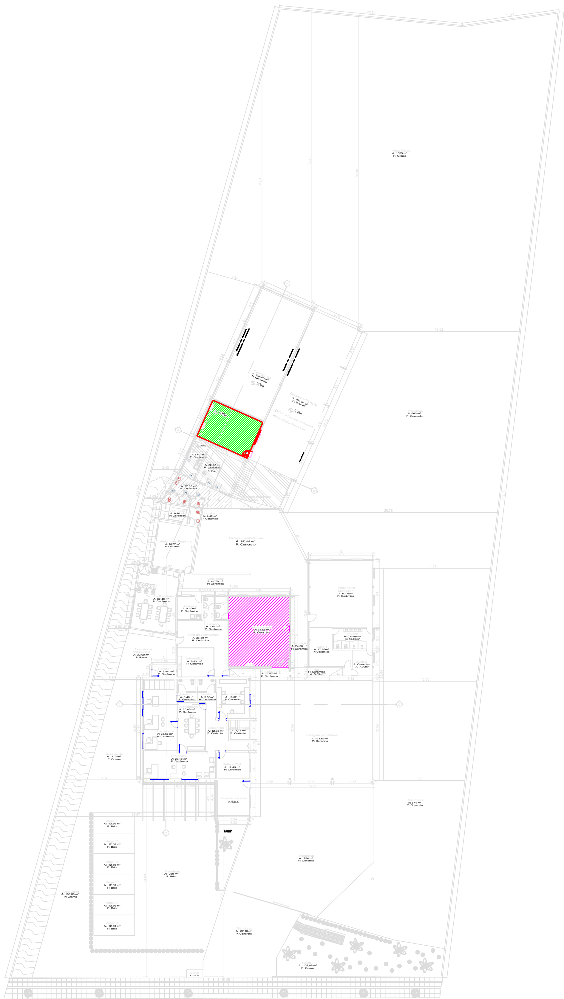
PLANTA - A CONSTRUIR ESCALA.: 1/250.