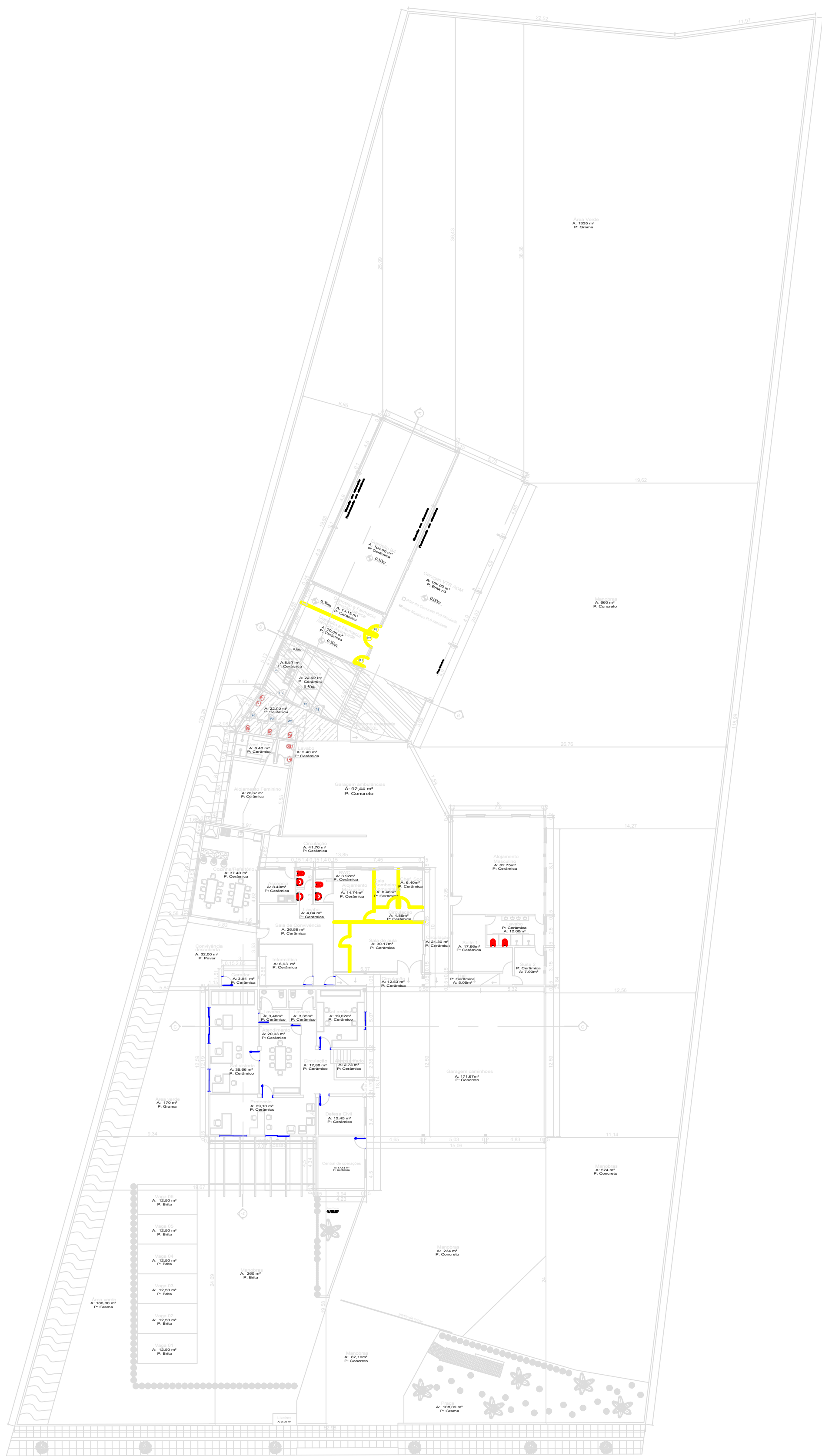
PLANTA - A DEMOLIR ESCALA.: 1/250.